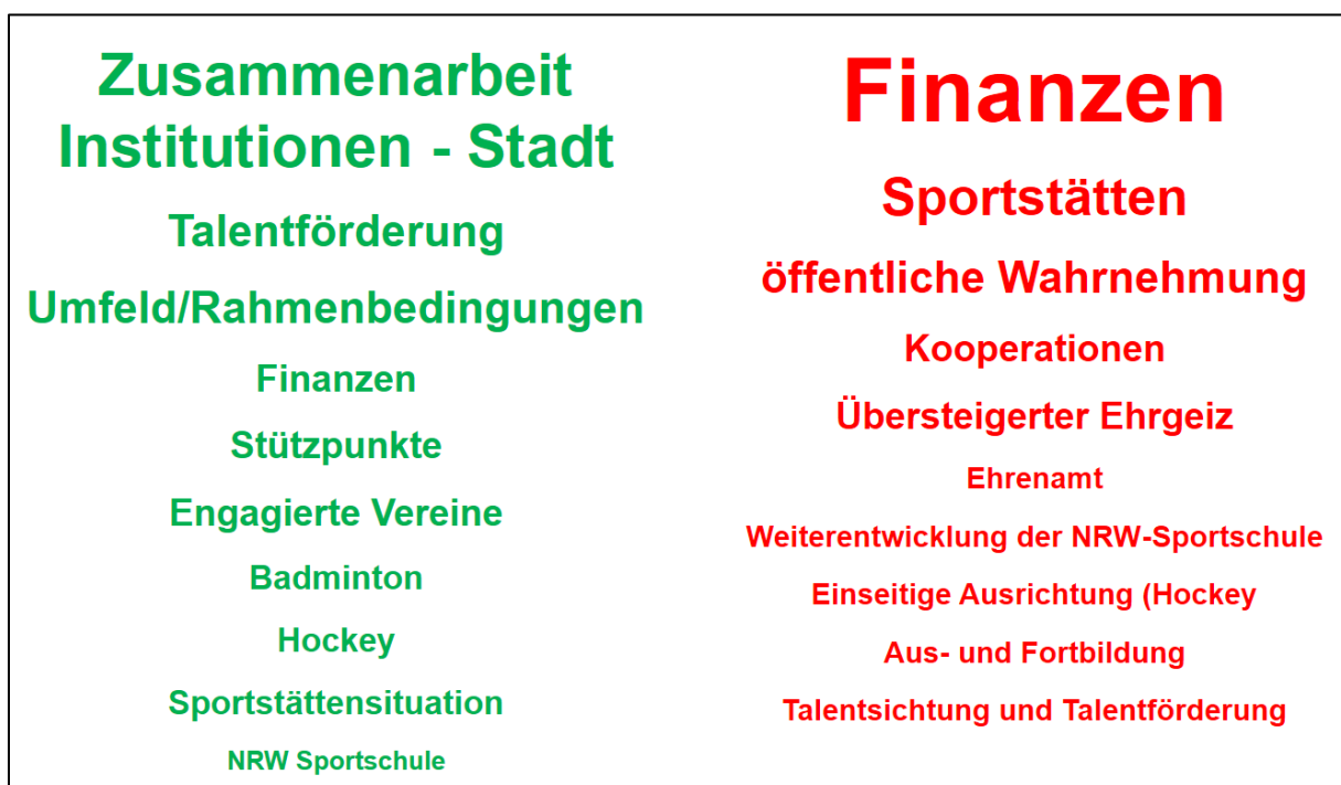
Abbildung 1: Stärken und Schwächen des Leistungssports in Mülheim an der Ruhr „Bitte nennen Sie uns drei Stärken / Schwächen, die Ihnen zur derzeitigen Situation im Leistungssport in Mülheim spontan einfallen.“; Hinweis: Die dargestellte Schriftgröße orientiert sich an der Anzahl der Nennungen

Bei den Schwächen zeigt sich sehr deutlich, dass die meisten Nennungen auf die finanzielle Situation im Leistungssport abzielen. Die Finanzen stellen mit Abstand die größte Schwäche aus Sicht der Befragten dar. Aber auch die Sportstätten sowie die öffentliche Wahrnehmung werden als Schwäche angesehen.