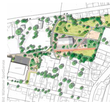
Skizze des geplanten Areals in Mülheim-Styrum.

Spiel- und Bewegungsfläche für Kinder, Jugendliche und Erwachsene weiterentwickelt werden. „Der entstehende Sport- und Bewegungspark Mülheim Styrum soll ein Ort für das Vereinsleben, die Schulen und Kitas sowie alle Freizeitsportler der Stadt werden“, erläutert Ellerwald. Bei einer öffentlichen Infoveranstaltung im Oktober 2016 im Stadtteil war das Projekt erstmals der Öffentlichkeit vorgestellt worden. Im Herbst 2017 machte zudem die Unternehmensgruppe Tengemann der Stadt anlässlich des 150-jährigen Firmenjubiläums ein besonderes Geschenk: Sie stiftete eine Freilufthalle der McArena GmbH für Styrum auf dem Gelände des Sportplatzes Von-der-Tann-Straße. Mittels eines Teilnahmewettbewerbs wurde Anfang 2018 das Planungsbüro DTP Landschaftsarchitekten GmbH aus Essen mit der konkreten Planung beauftragt. Die Realisierung des Sportparks Styrum wurde dabei in zwei Bauabschnitte unterteilt. Die erste Phase (ab Herbst 2018) sieht, neben der Errichtung der Freilufthalle, die Gestaltung der unmittelbar daran angrenzenden Flächen vor. Es soll eine interaktive Torwand, ein