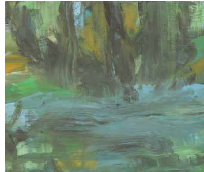
Ausschnitt: Landschaft Pigmente und Kunstharz auf Leinwand | 40 x 30 cm