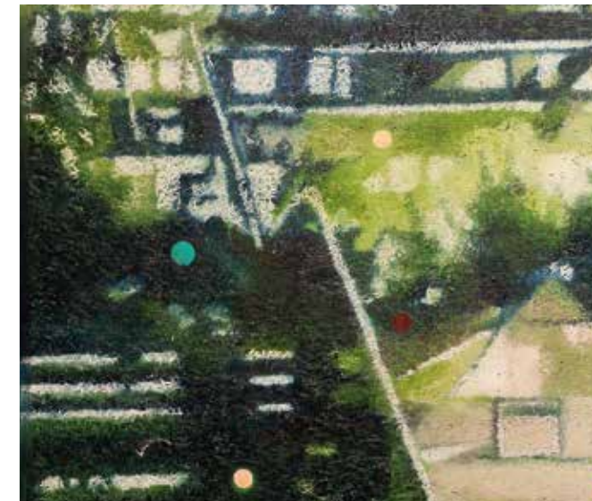
Ausschnitt: ohne Titel Öl auf Leinwand | 40 x 40 cm