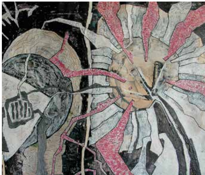
Ausschnitt: Zweiheit Acryl auf Leinwand | 70 x 100 cm