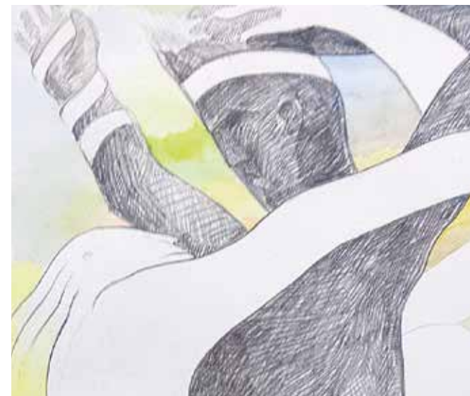
Ausschnitt: Zusammenführung (LaoKoon) Bleistift und Aquarell auf Büten | 60 x 80 cm