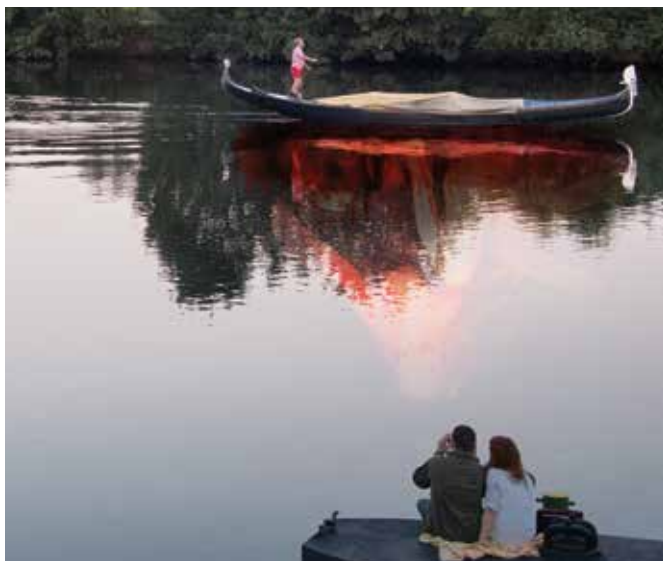
Ausschnitt: ohne Titel technik | breite x höhe cm