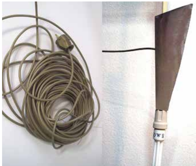
Ausschnitt: Blitz des Zeus an der Nabelschnur der Moderne Installation | 100 x 320 x 60 cm