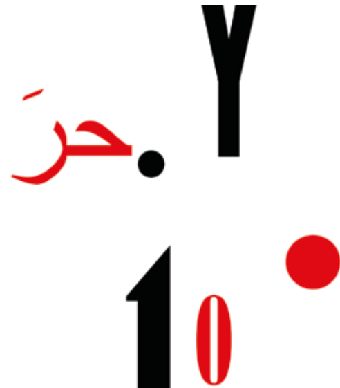
Ausschnitt: Zeitzünder auf den Lippen Tintenstrahl Druck auf Stoffobjekt | 85 x 60 cm