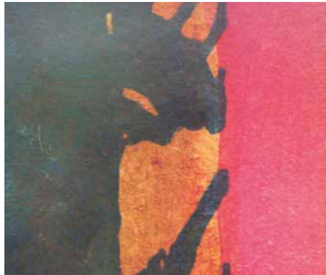
Ausschnitt: keine Angabe Tempera- und Harzölfarbe auf Büten | 60 x 80 cm