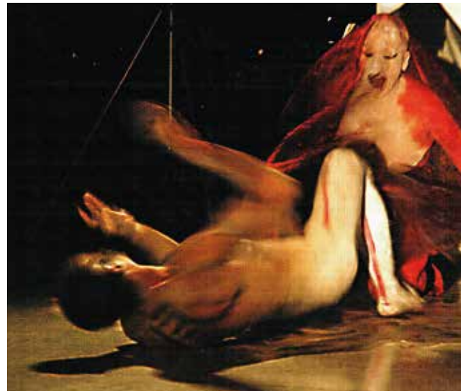
Ausschnitt: Performance Butoh C-Print | 60 x 40 cm