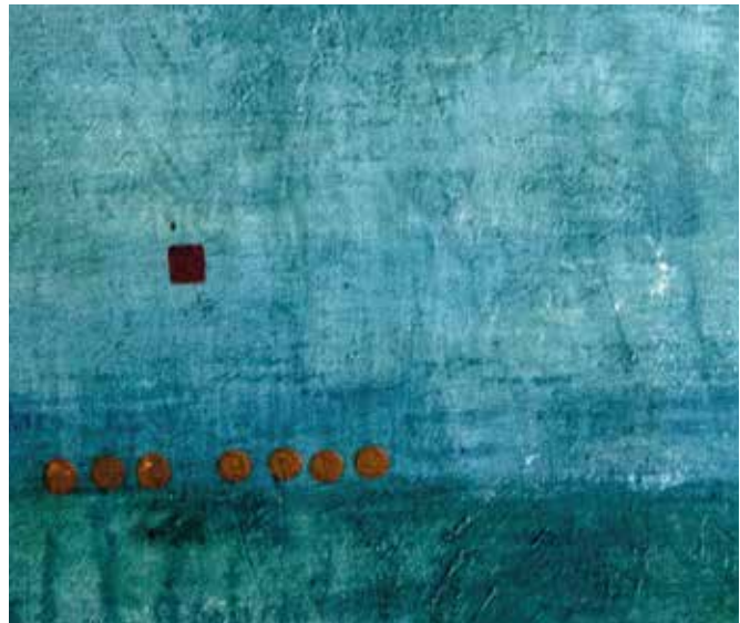
Ausschnitt: 7 punkte - 1 quadrat am horizont Bienenwachslasur und Öl auf Leinwand | 80 x 80 cm