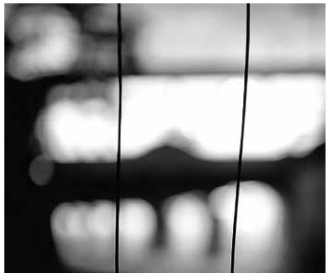
Ausschnitt: Duisburg Bruckhausen 1355 - 2013 Pigment Print | 60 x 50 cm