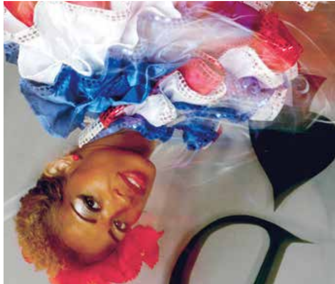
Ausschnitt: Dialog Inkjet-print auf fine art Paper | 62 x 92 cm