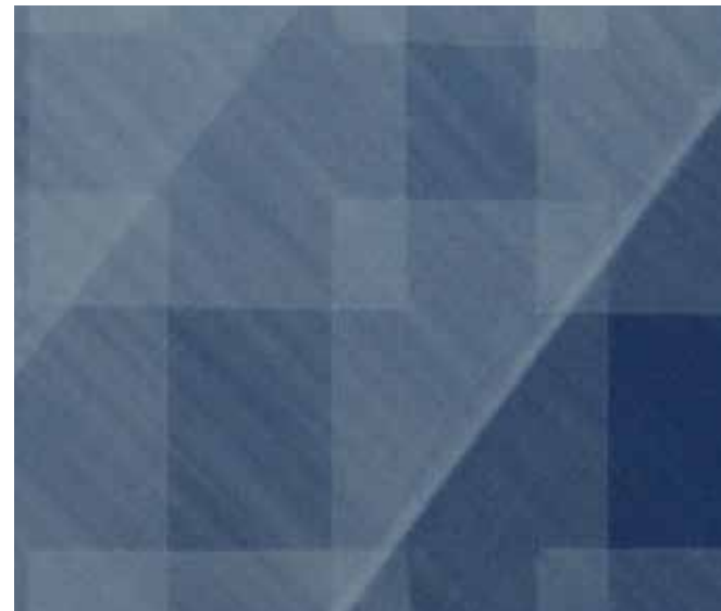
Ausschnitt: #2001 Pigment und Acryl auf Multiplex | 48 x 38 x cm