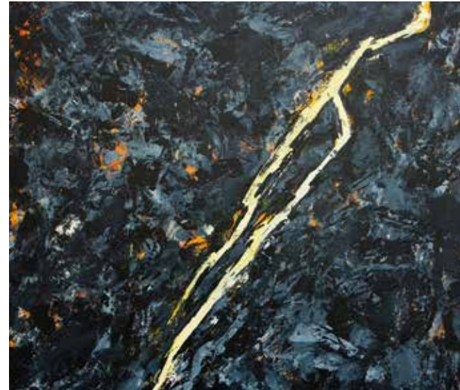
Ausschnitt: Geistesblitz Öl auf Leinwand | 90 x 70 cm