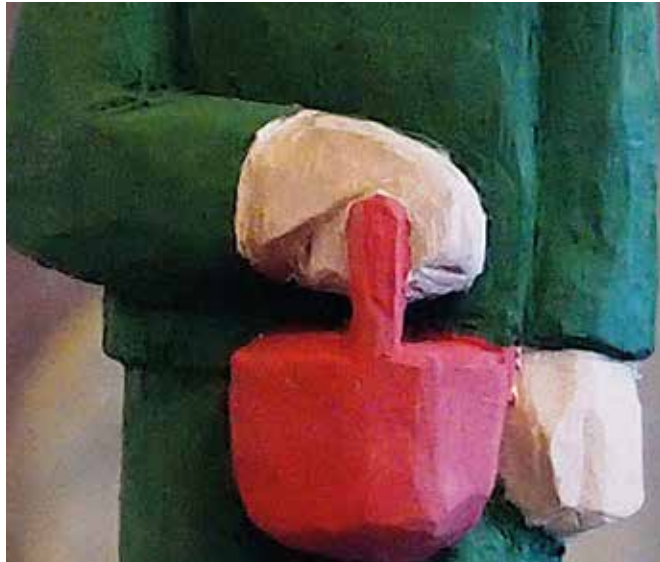
Ausschnitt: das Himbeerkorbchen Skulptur | Höhe ca. 17 cm