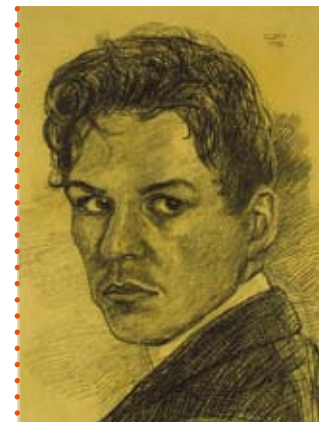
Otto Pankok: Selbstbildnis, Kopf n.L., 1909 © Eva Pankok

Dauer: 150 Min inkl. Praxisteil | Zielgruppe: Sekundarstufe I und II Kosten: 4 € pro Schüler inkl. Eintritt und Material