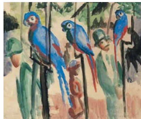
August Macke: Bei den Papageien, 1914

Dauer: 120 Min inkl. Praxisteil | Zielgruppe: Kindergarten, Primarstufe Kosten: 2 € pro Kind inkl. Eintritt und Material