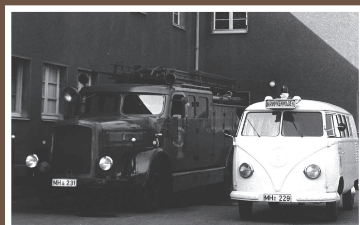
KTW, VW Bus T 1a, Baujahr vor 1955