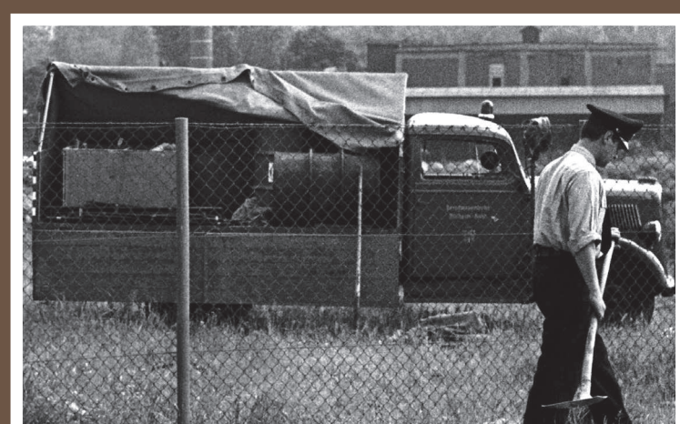
LKW 1, Opel Blitz, Baujahr 1939 (ex LF 8)