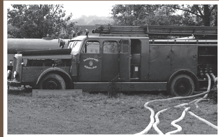
LF 25, Magirus Deutz FS 145, Baujahr um 1940