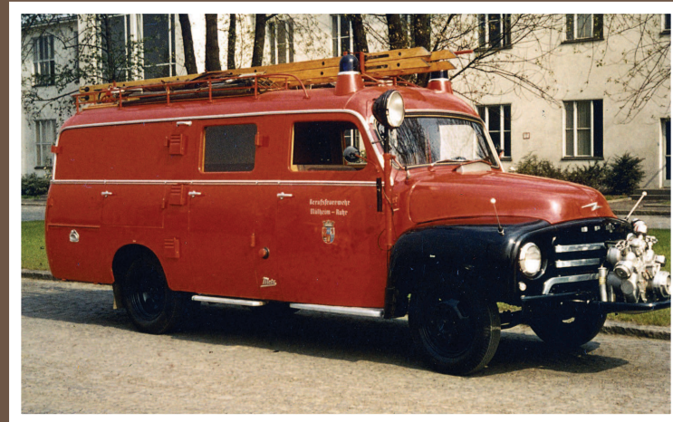
LF 8, Opel Blitz/Metz, Baujahr 1958