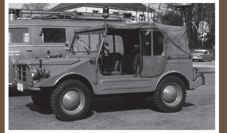
FukoW, DKW Munga 4, Baujahr 1956