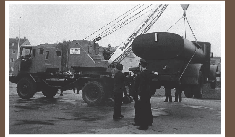
Sprengwagen (rechts im Bild), Leihfahrzeug der Stadtreinigung