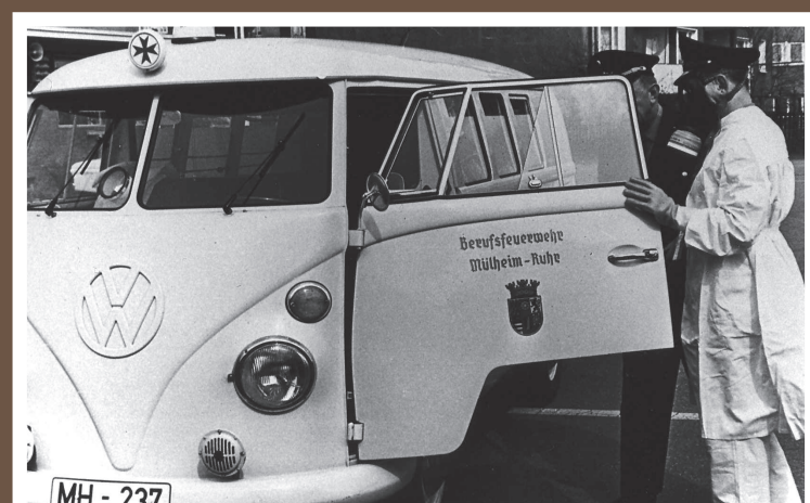
KTW, VW T 1b/Miesen, Baujahr 1958