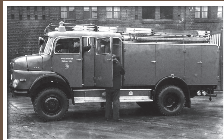
TLF 16/2, MB LAF 322/Metz, Baujahr 1960