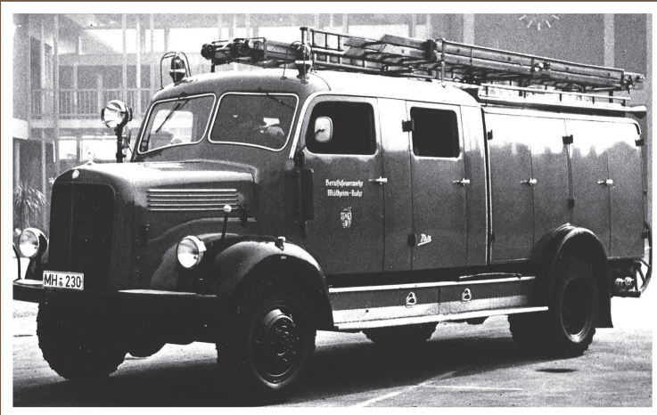
LF 16, MB LAF 311/Metz, Baujahr 1955