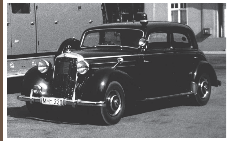
KDOW, MB 170 S, Baujahr unbekannt