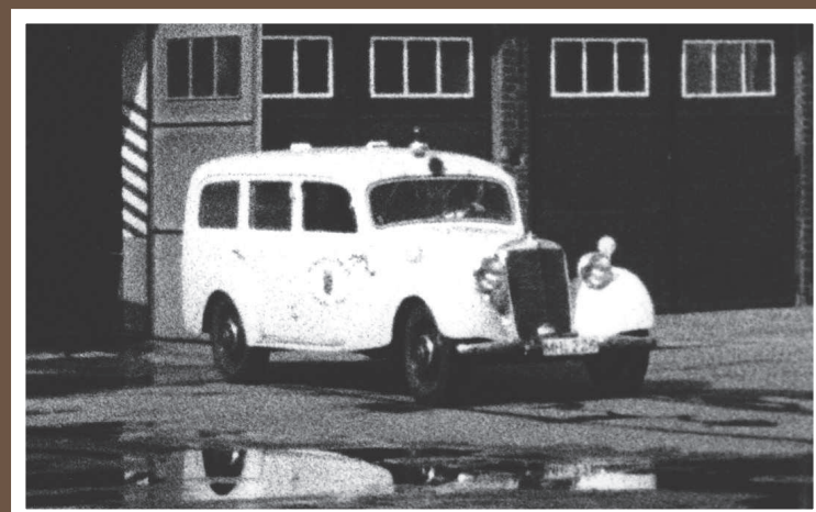
KTW, MB 170/Miesen, Baujahr 1949