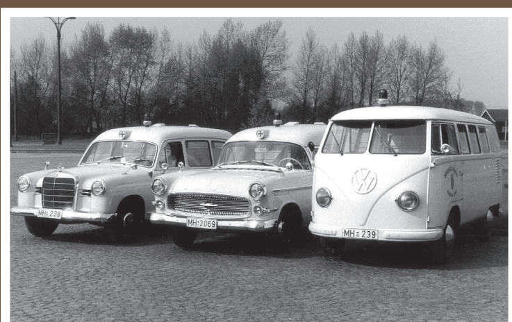
KTW, Opel Kapitän/Miesen (mitte), Baujahr 1959