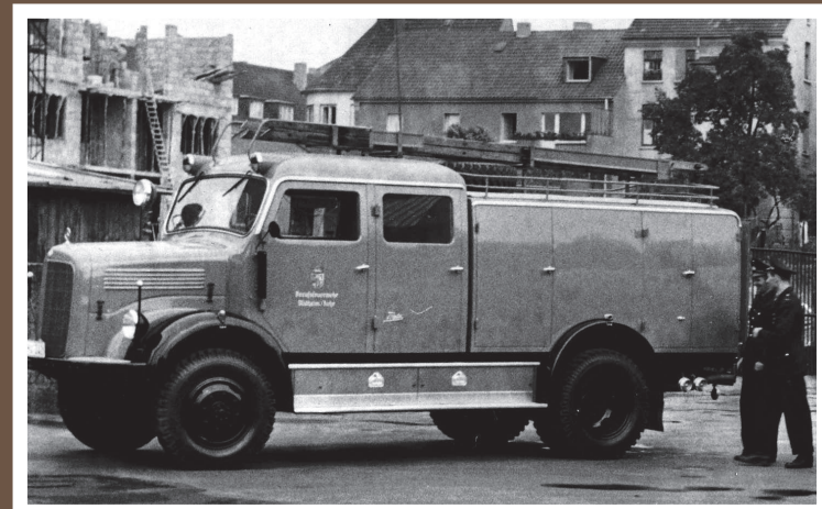
TLF 16/1, MB LAF 311/Metz, Baujahr 1956