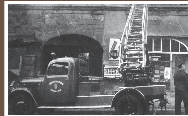
DL 17, MB L 1500/Metz, Baujahr 1941