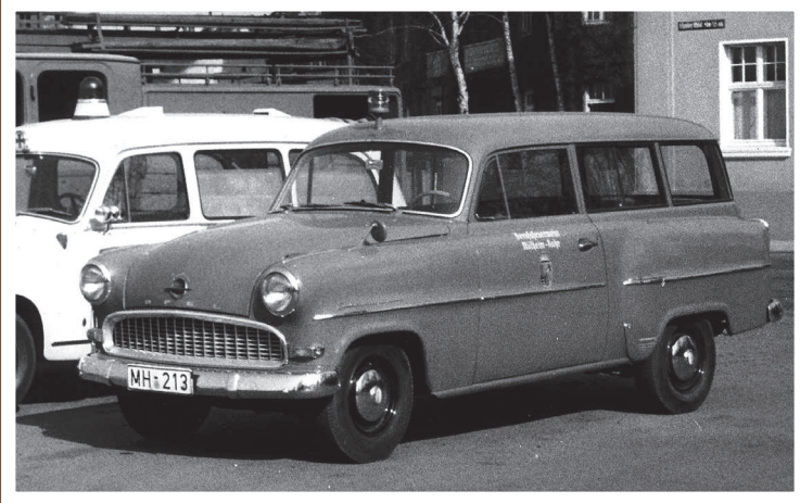
KDOW, Opel Olympia, Baujahr vor 1959