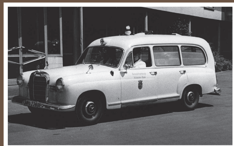
KTW, MB 180/Miesen, Baujahr 1955