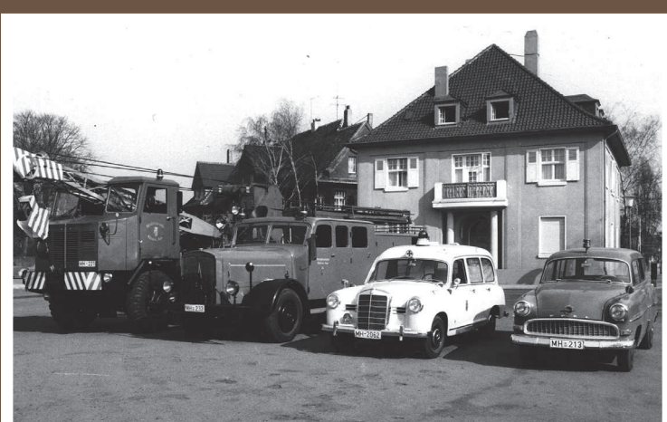
RKW, Magirus Deutz M 45, Baujahr um 1938 (ex LF 25)