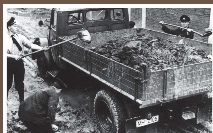
LKW 2, Magirus Deutz, Mercur 125, Baujahr 1960