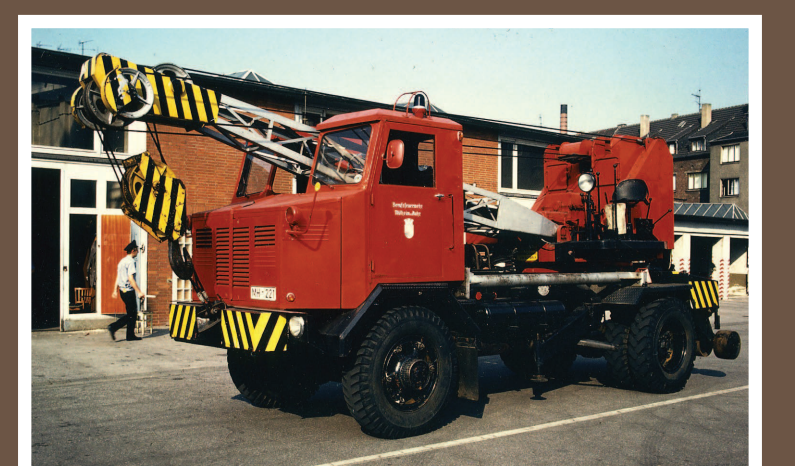
FwK 15, Krupp Drache/ Ardelt, Baujahr 1956