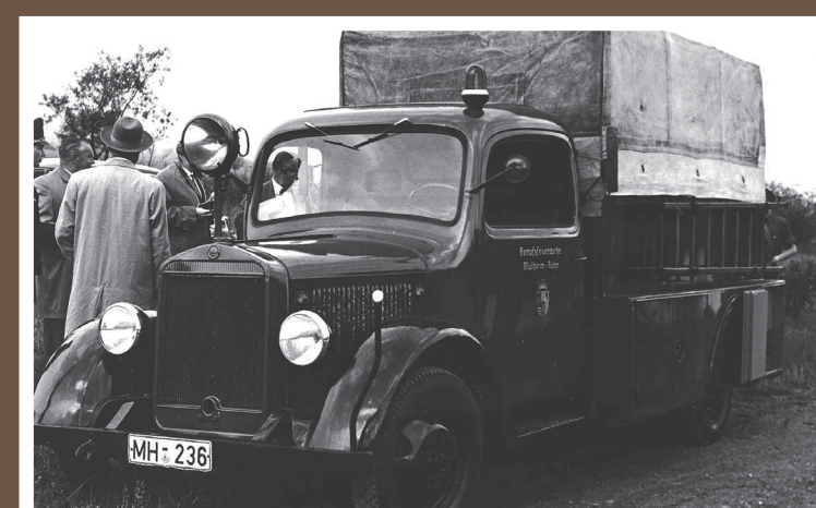
WUW, MB L 1500, Baujahr unbekannt (ex LF 8)