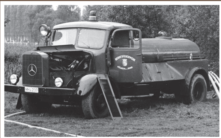
TLF 25, MB 4500/Eigenbau, Baujahr 1949