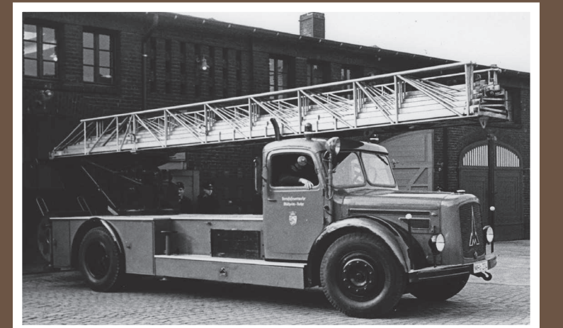
DL 32, Magirus Deutz GFL 145, Baujahr 1943