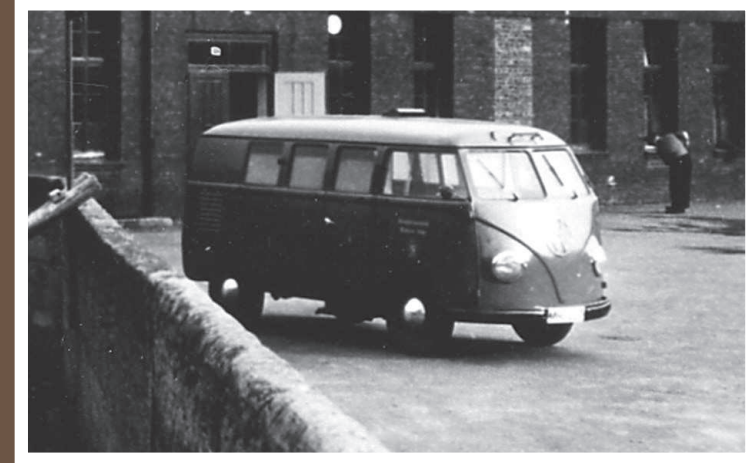
Rev.-Wg., VW T 1a, Baujahr vor 1955 (ex KW)