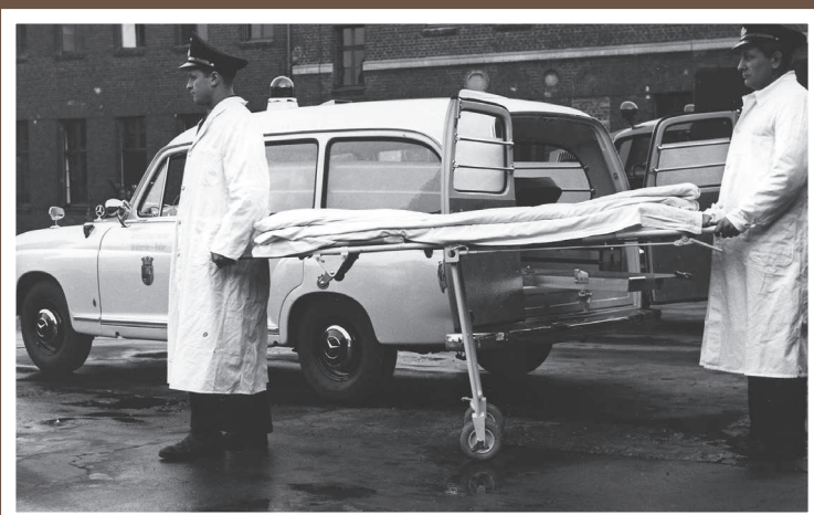
KTW, MB 190/Miesen, Baujahr 1958